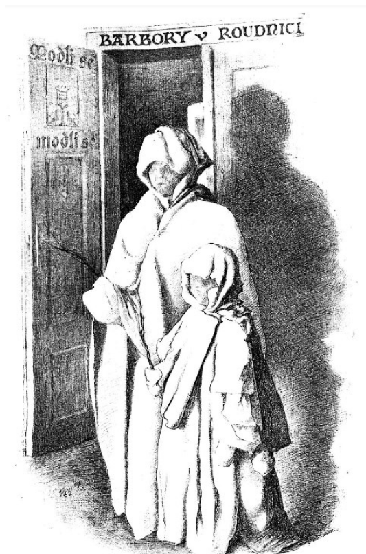
Obehůzka Barborek v Roudnici. Kreslil prof. Karel Rozum.

Zdroj: ROZUM, Karel, 1907. Obchůzka Barborek v Roudnici. Český lid. 16(1). ISSN 0009-0794. Dostupné také z: http://www.digitalniknihovna.cz/knav/uuid/uuid:b63af1a6-4611-11e1-1586-001143e3f55c